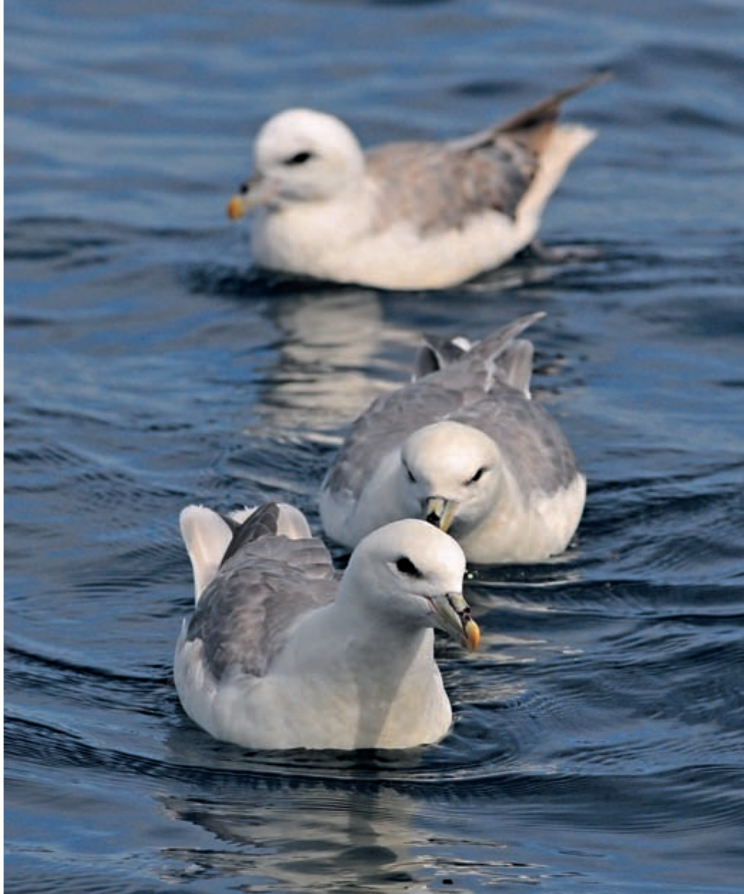
Eine der besten Möglichkeiten zur Beobachtung von Eissturmvögeln in Deutschland bietet der Lummenfelsen auf Helgoland.

In allen Monaten hängt der Beobachtungserfolg, abgesehen von der Seevogelkolonie am Helgoländer Lummenfelsen, wesentlich von den Wetterbedingungen ab. Es macht Sinn, in Abhängigkeit von der Witterung kurzfristig aufzubrechen. Einen guten Überblick über das aktuelle Zugeschehen bietet die Seite www.trektellen.nl . Dort werden aktuelle Tagessummen von diversen europäischen Beobachtungspunkten, darunter die Kurpromenade von Westerland, veröffentlicht. Neben echten